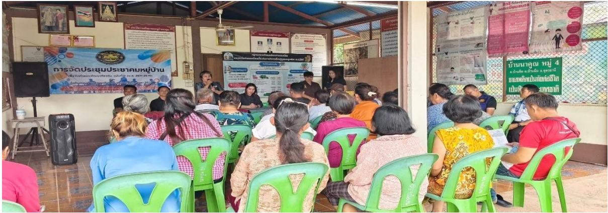
ภาพประกอบการดำเนินโครงการจัดประชุมประชาคมพัฒนาท้องถิ่น ในหมู่บ้านตำบลบ้านค้อ ประจำปี ๒๕๖๙